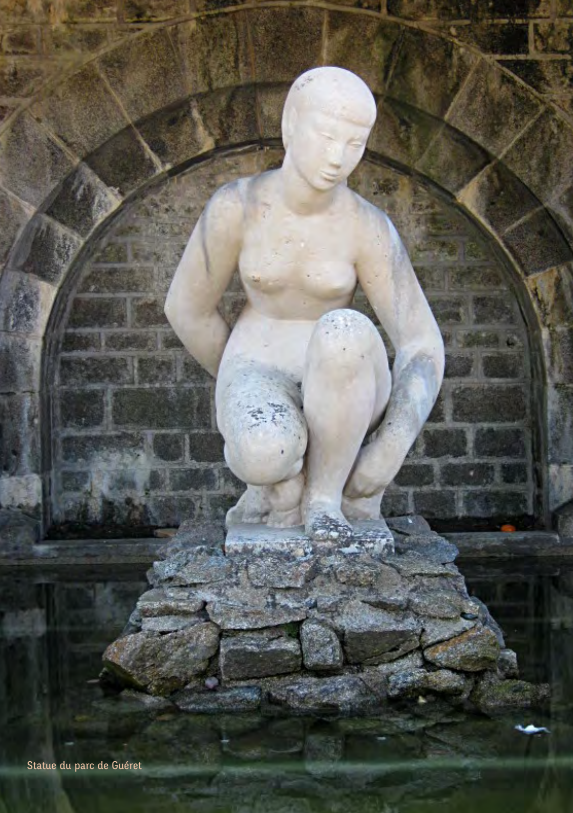
Statue du parc de Guéret